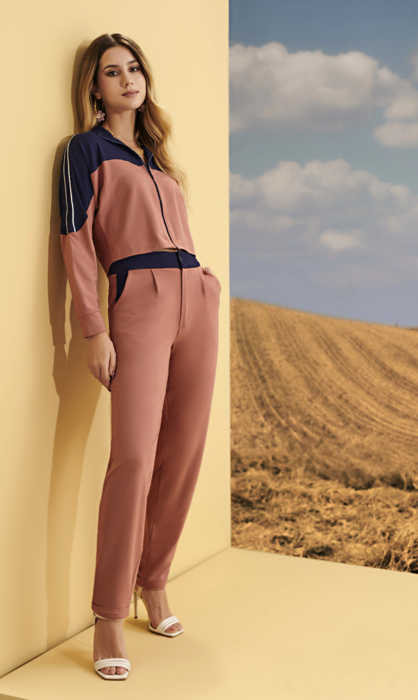
35 CONJUNTO • P M G | Moletom | Rosê/Azul