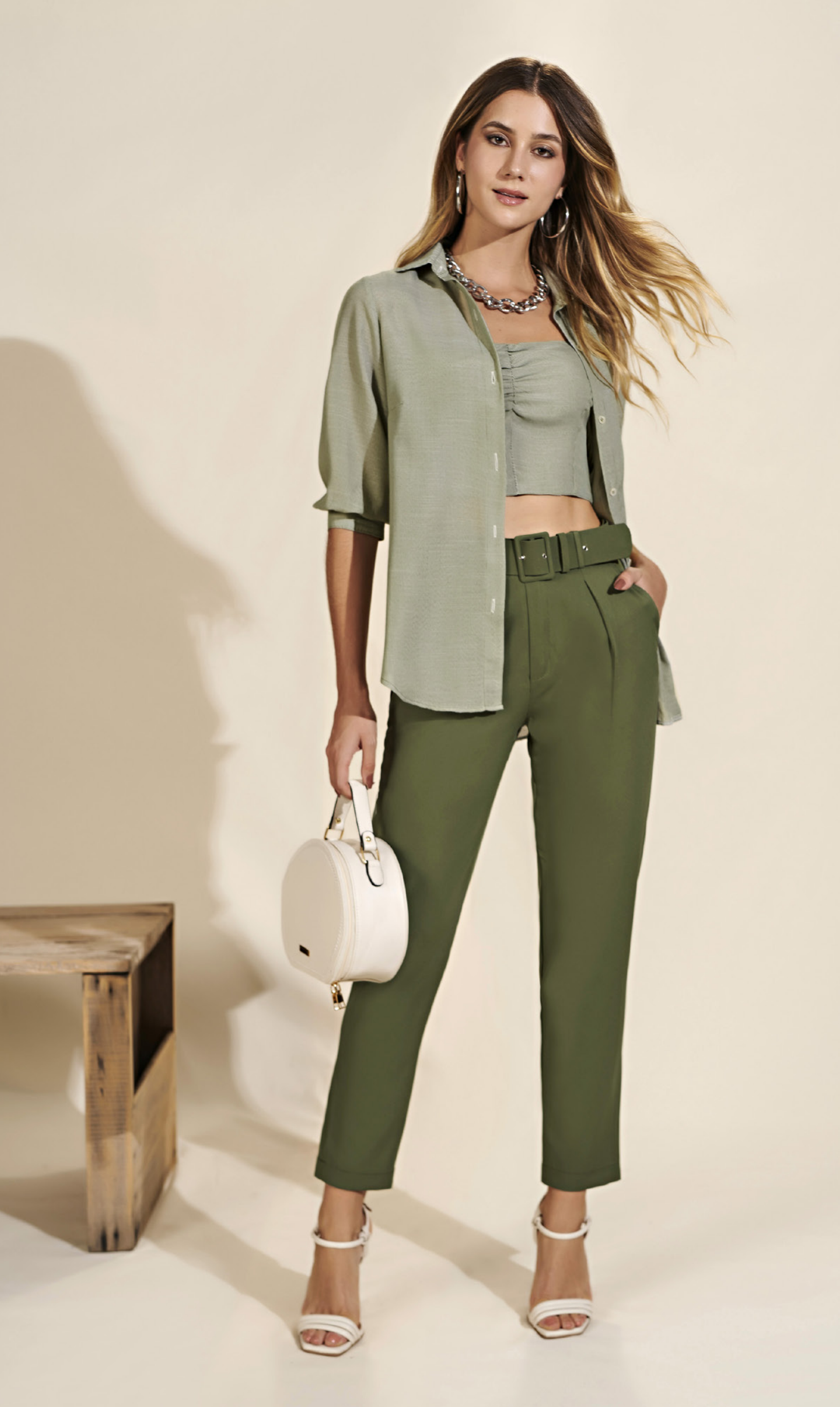
63 TWIN-SET • PM G | Crepe | Listrado CALÇA • PM G | Crepe | Verde Militar