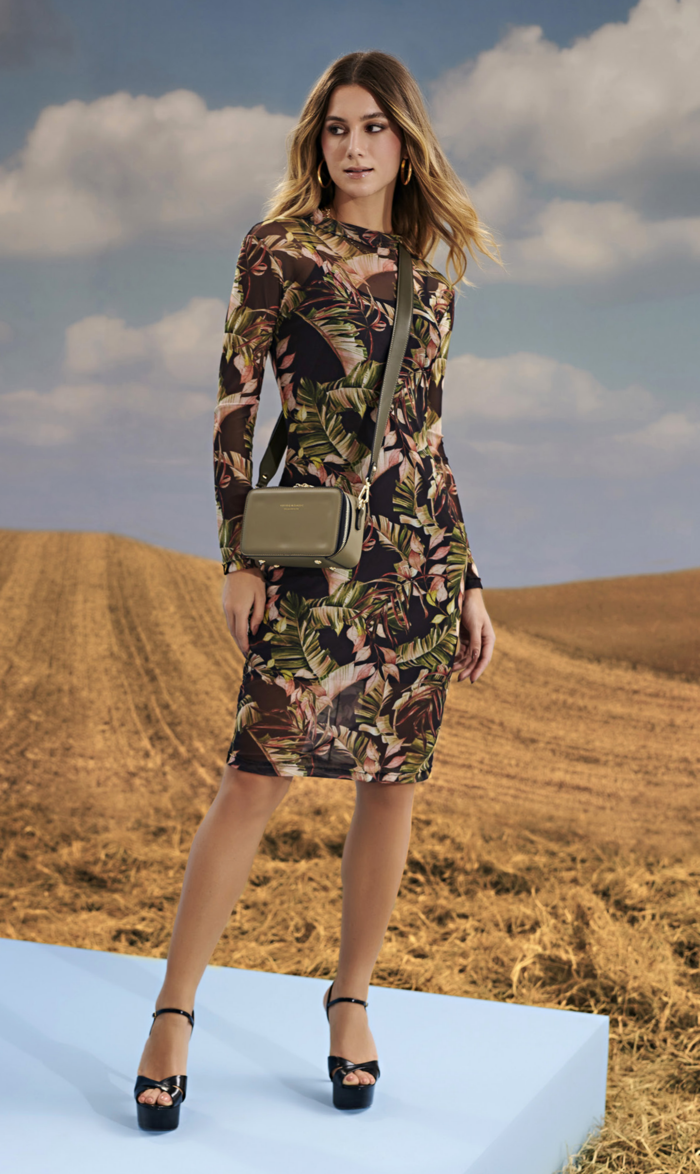
15 VESTIDO • P M G | Tule | Estampado