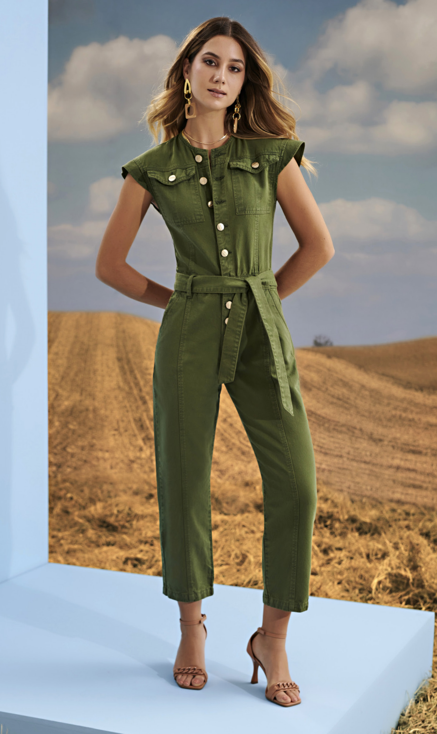
1 MACACÃO • 38 ao 46 | PT White Denim Trend | Verde Militar