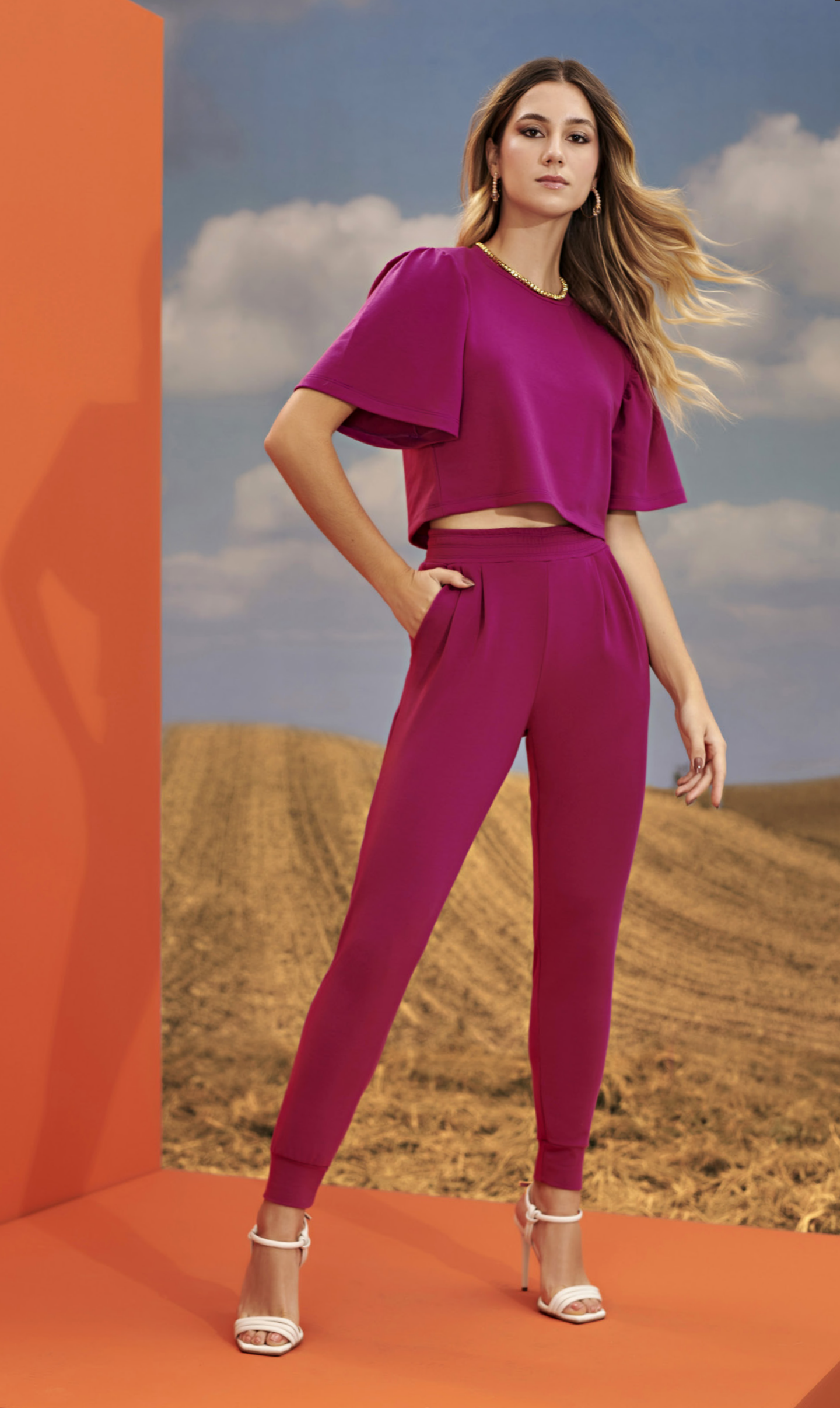
57 CONJUNTO • P M G | Moletinho | Fúcsia