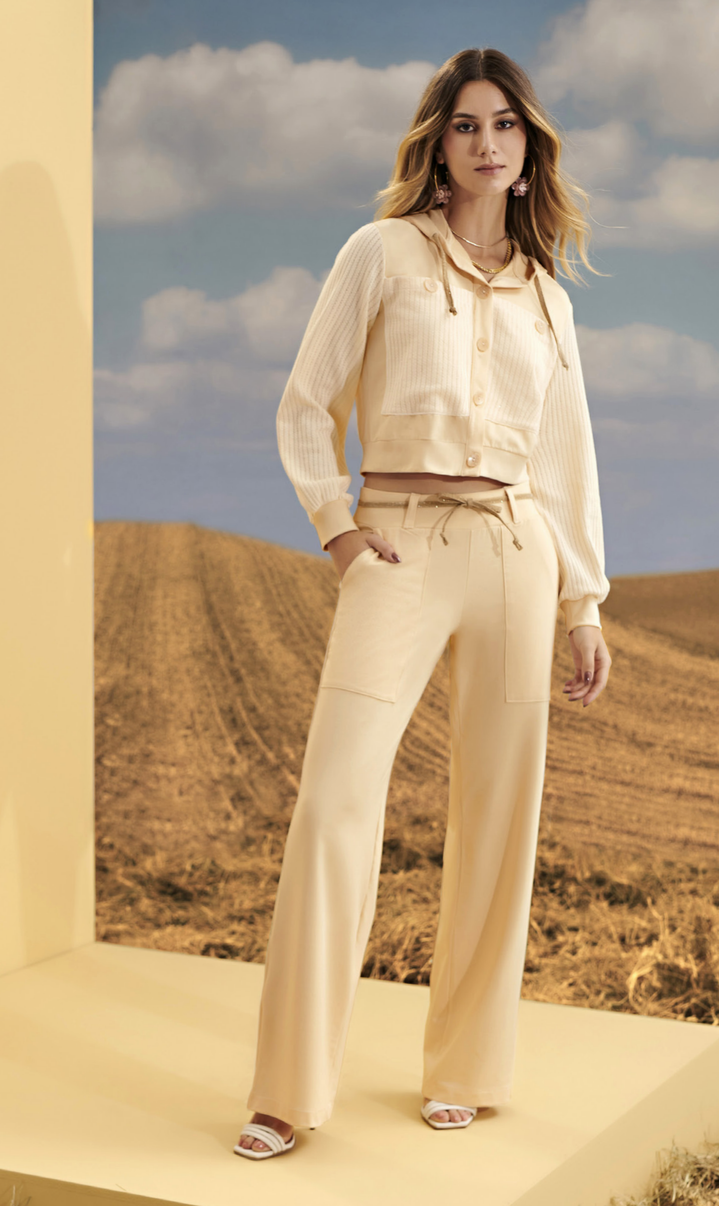
37 CONJUNTO • P M G | Moletom | Bege