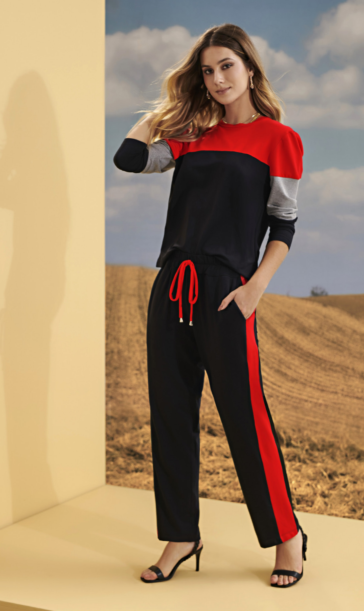
44 CONJUNTO • P M G | Moletinho | Preto/Vermelho/Cinza Mescla