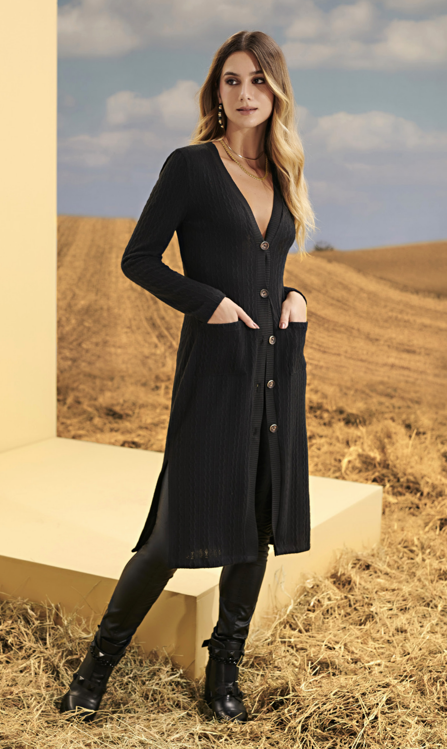
30 CARDIGAN • P M G | Tricot | Preto