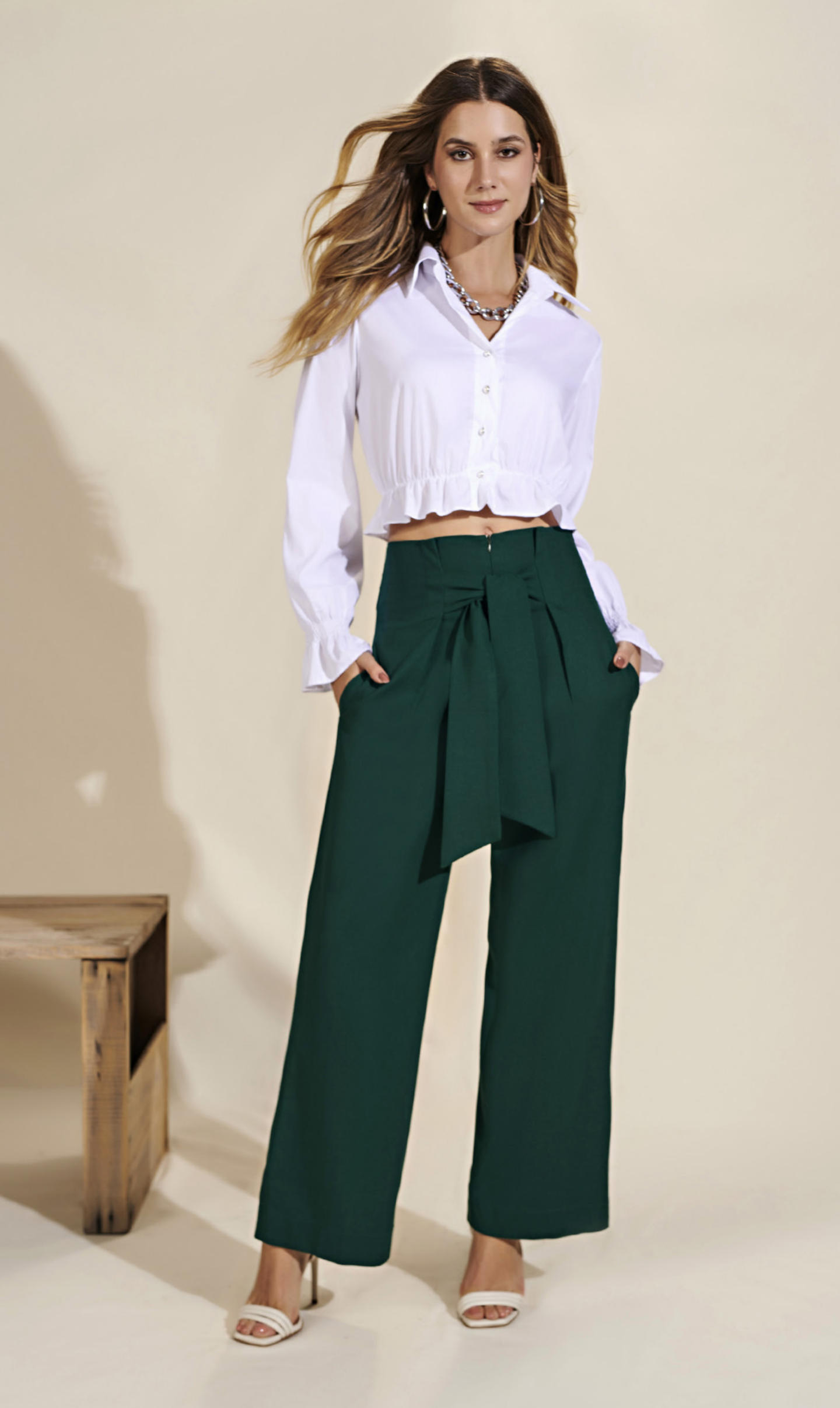
52 CROPPED • P M G | Tricoline | Branco CALÇA • 38 40 42 | Linho | Verde