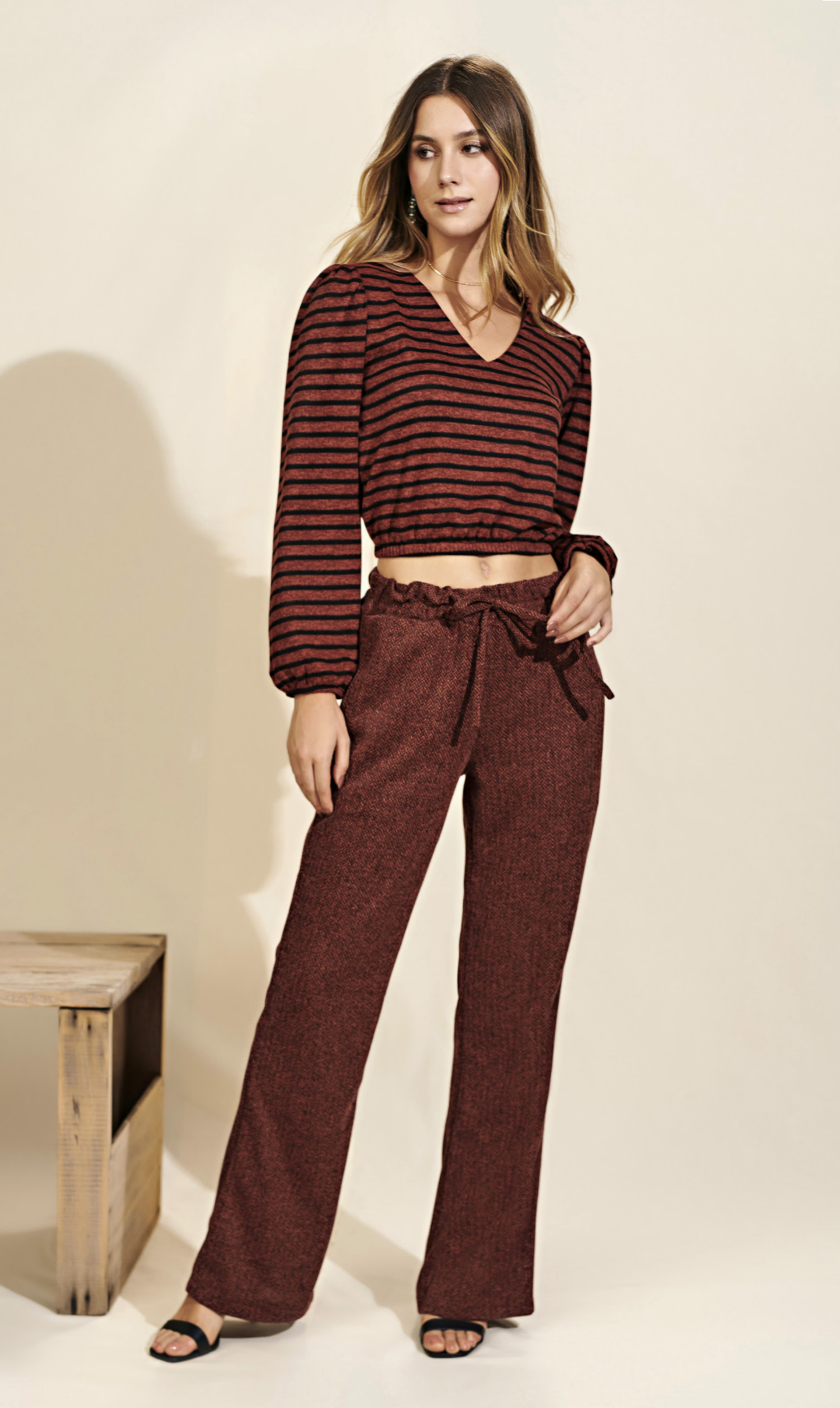
41 CONJUNTO • P M G | Tricot | Marrom