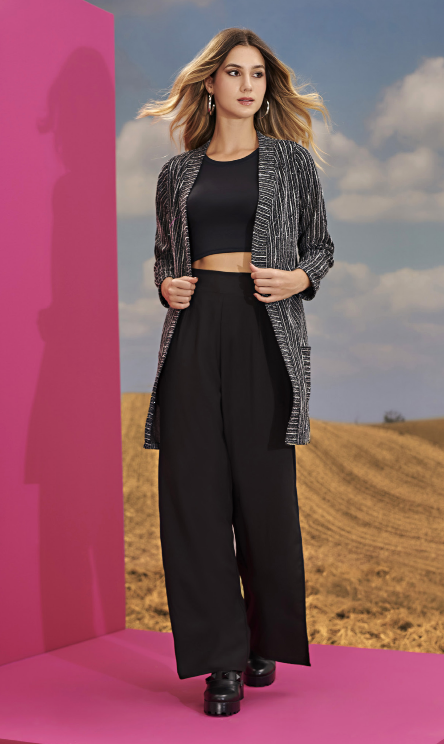
67 TWIN-SET • P M G | Tricot/Modal | Preto/Listrado