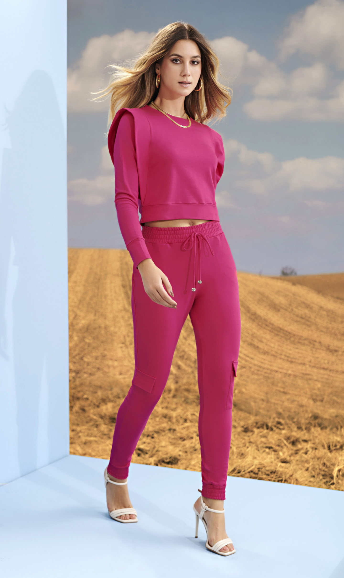
21 CONJUNTO • P M G | Moletinho | Rosa