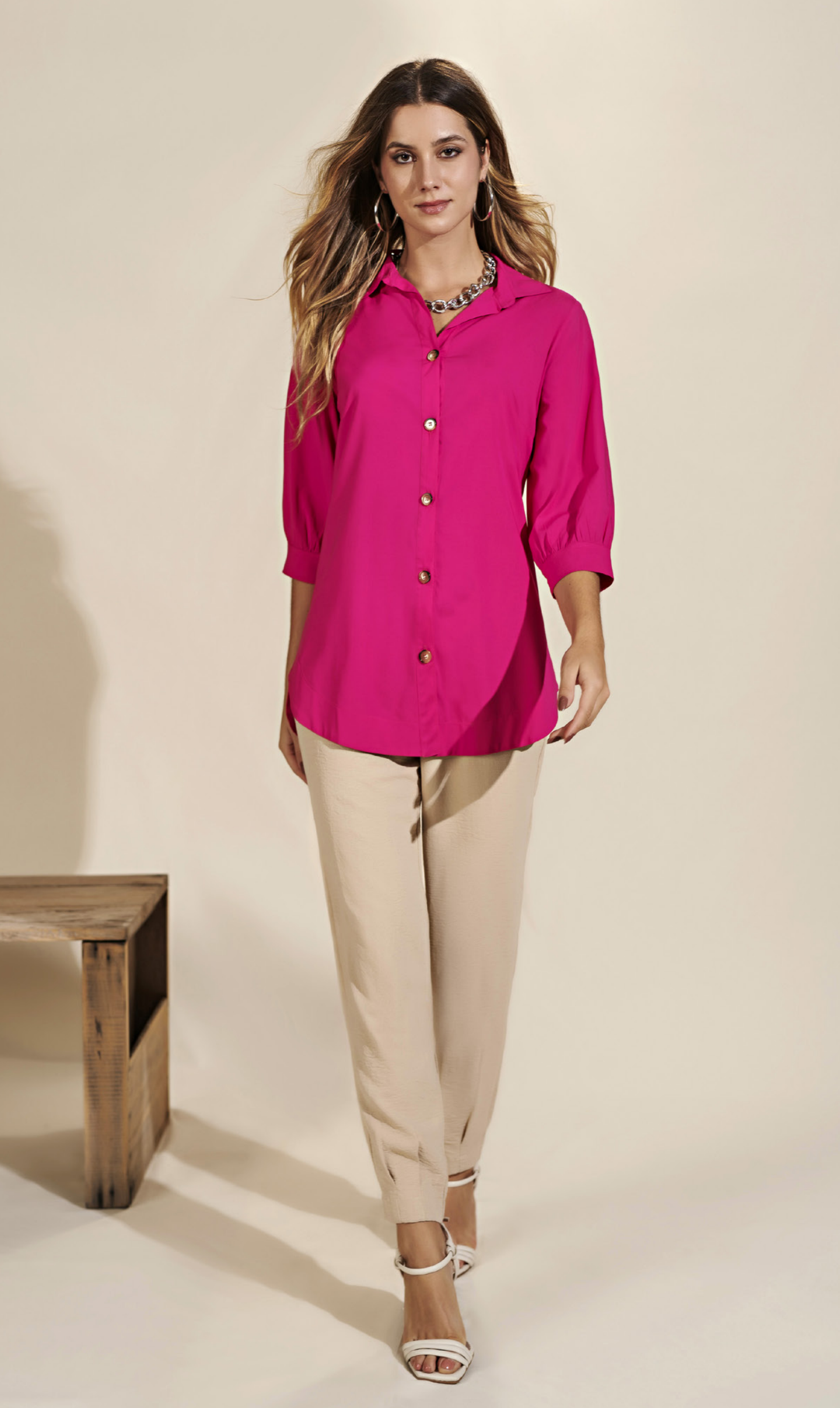
61 CAMISA • P M G | Crepe | Rosa