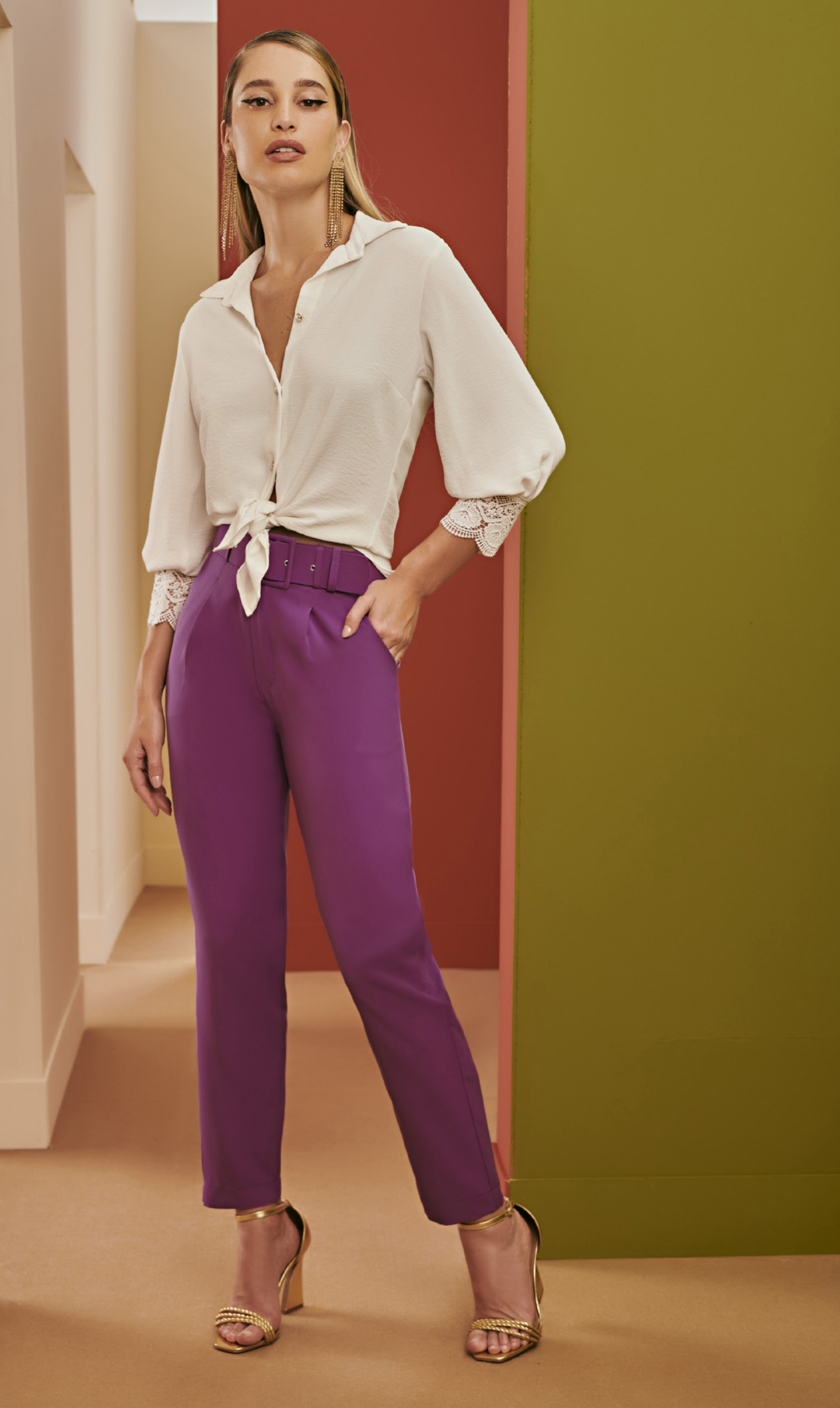
76 CAMISA • P M G | Crepe | Off White CALÇA • P M G | Crepe Alfaiataria | Roxa