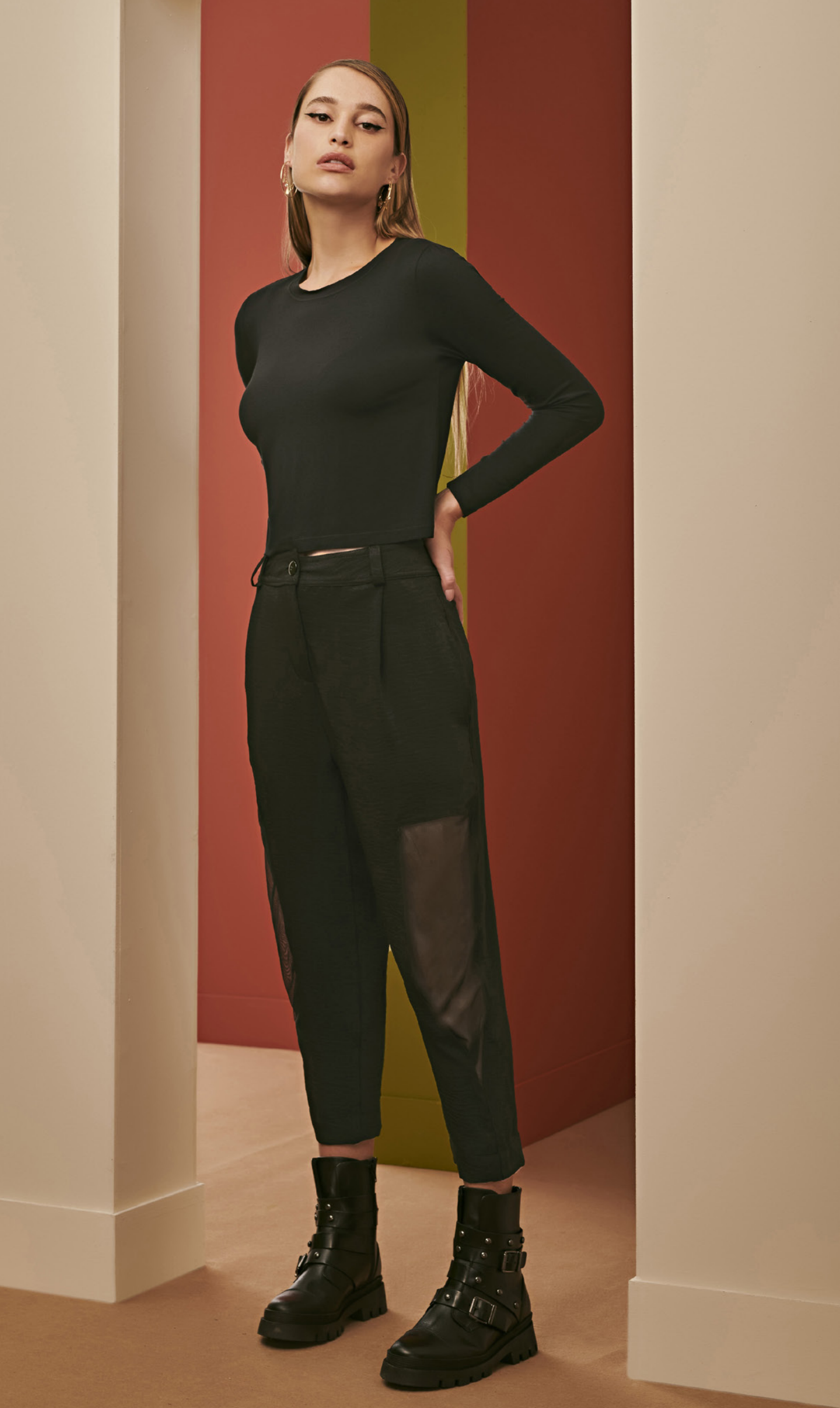
35 CONJUNTO • P M G | Viscolykra/Crepe Valentino | Preto