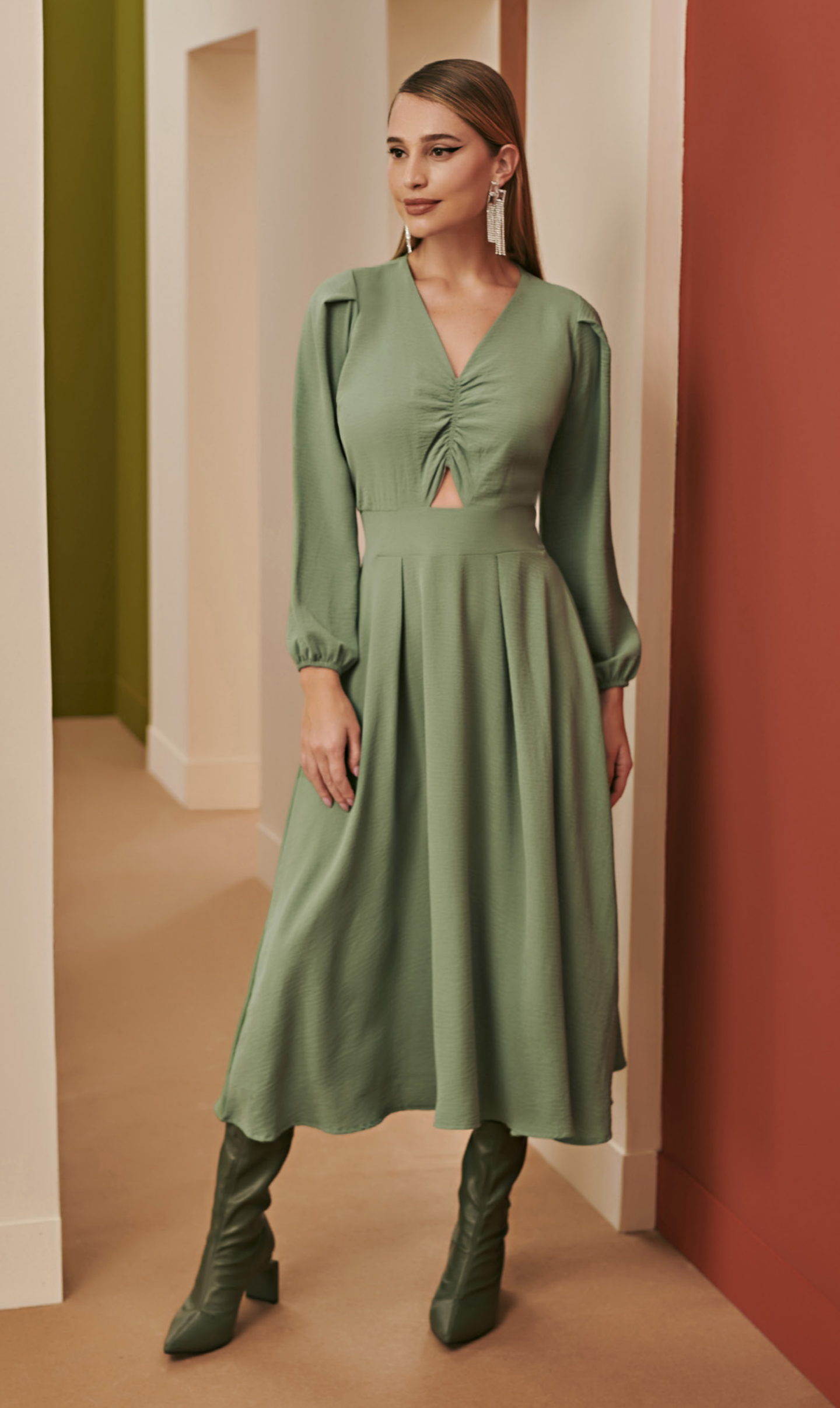
3 VESTIDO • P M G | Crepe Air Flow | Verde