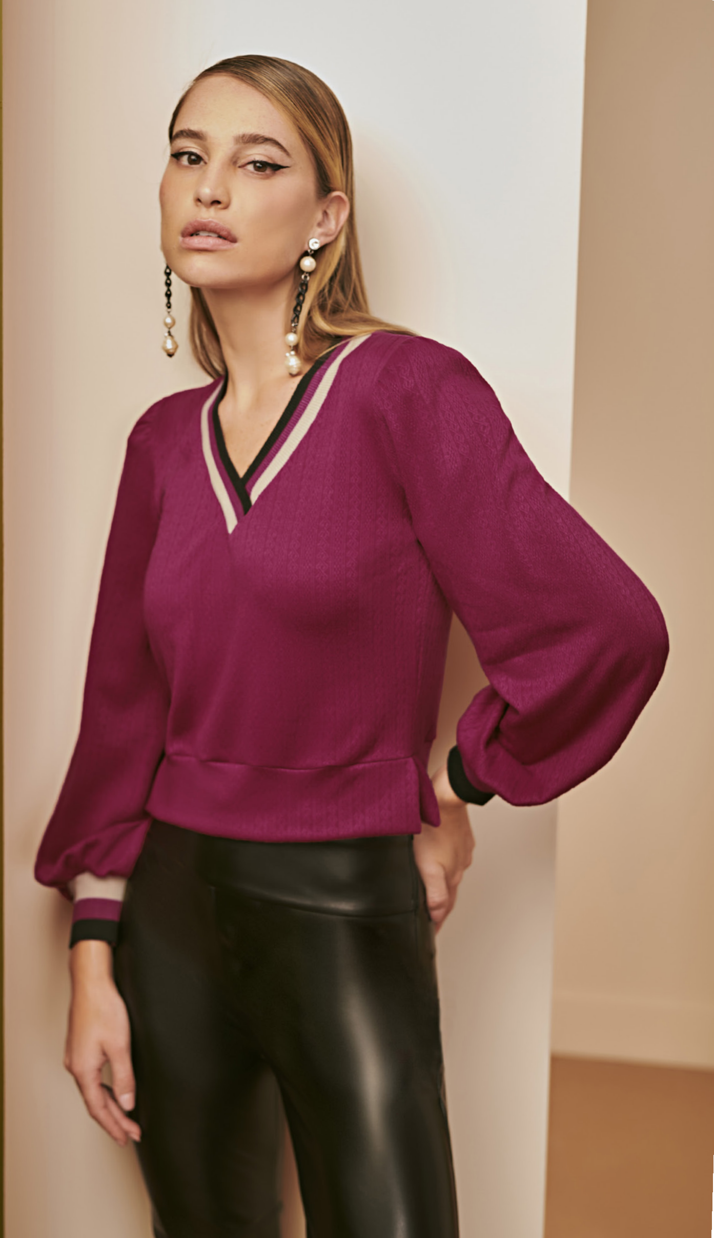
17 BLUSA • P M G | Tricot Suíço | Fúcsia