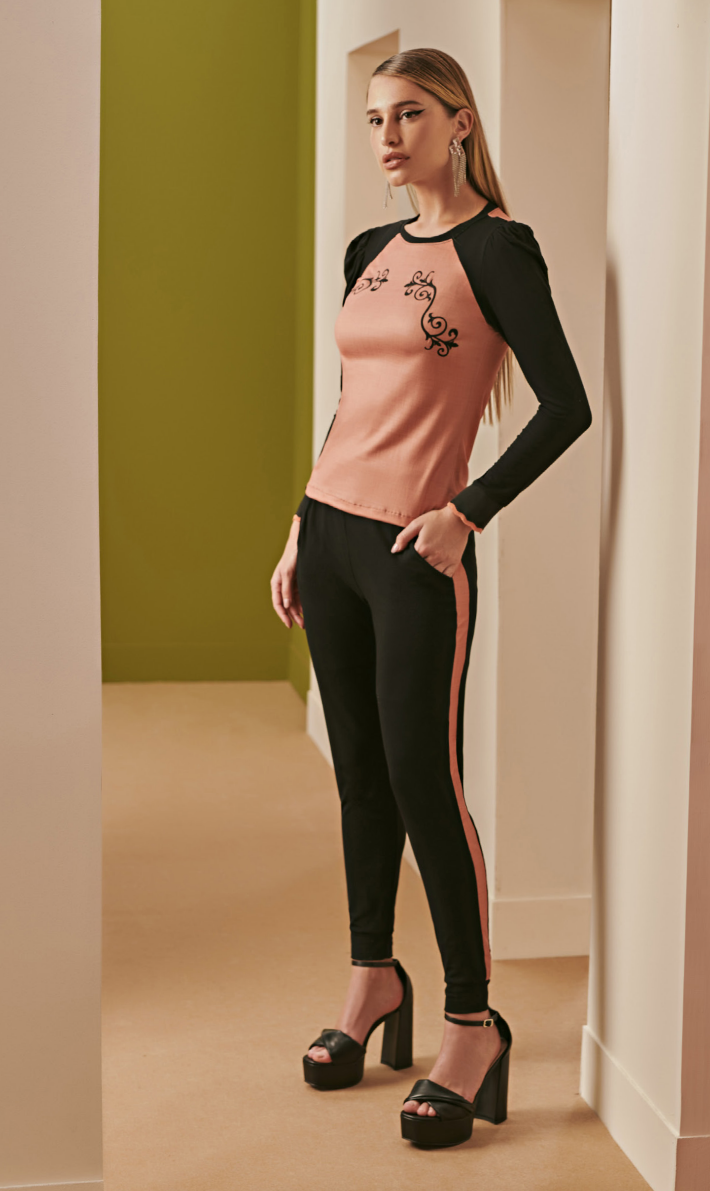
38 CONJUNTO • MG | Viscolykra | Preto