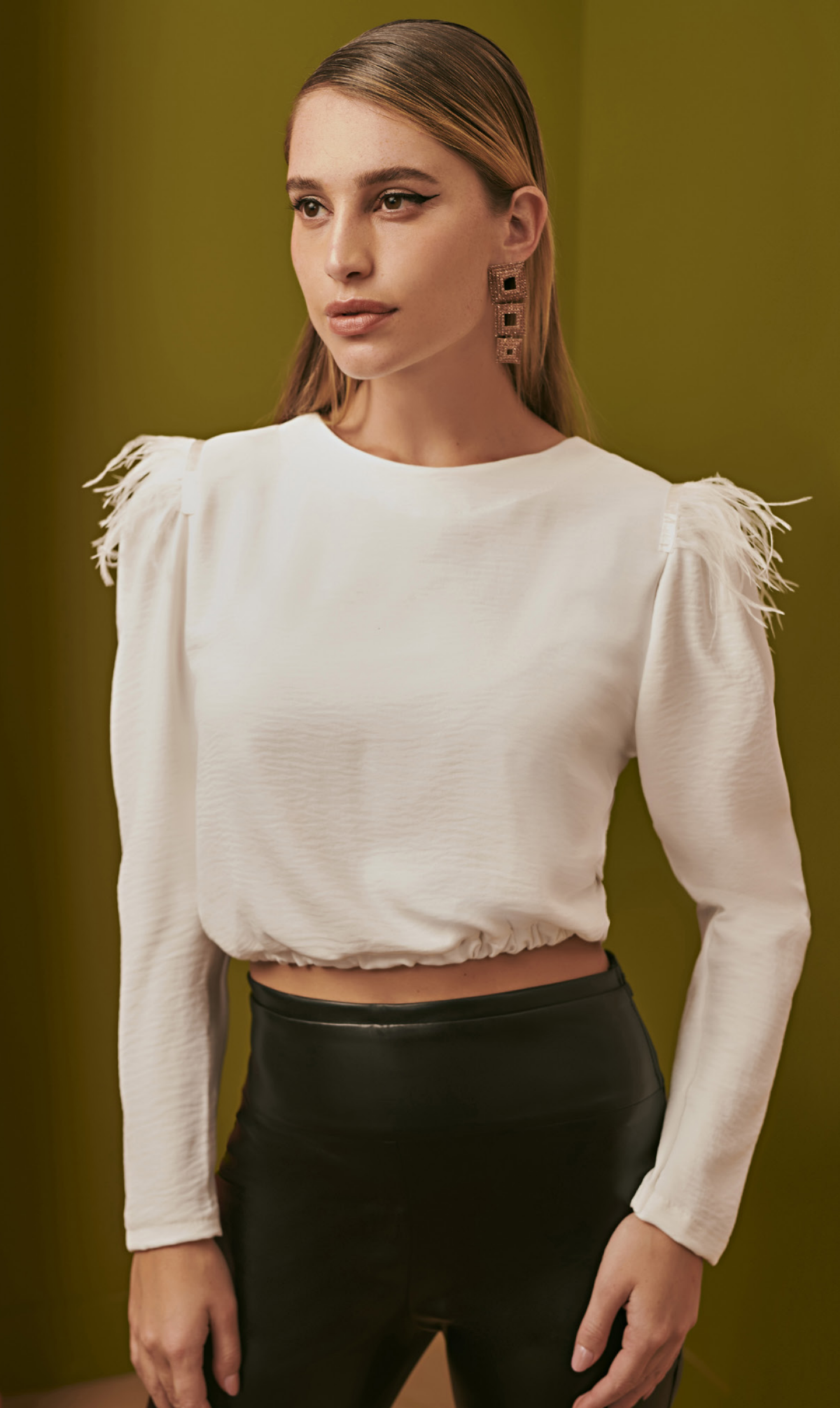
36 BLUSA • M G | Crepe Amassadinho | Off White