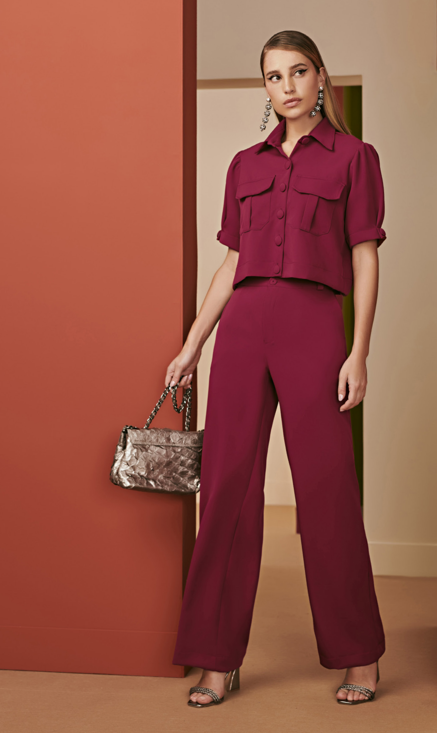
69 CONJUNTO • P M G | New Look | Bordô