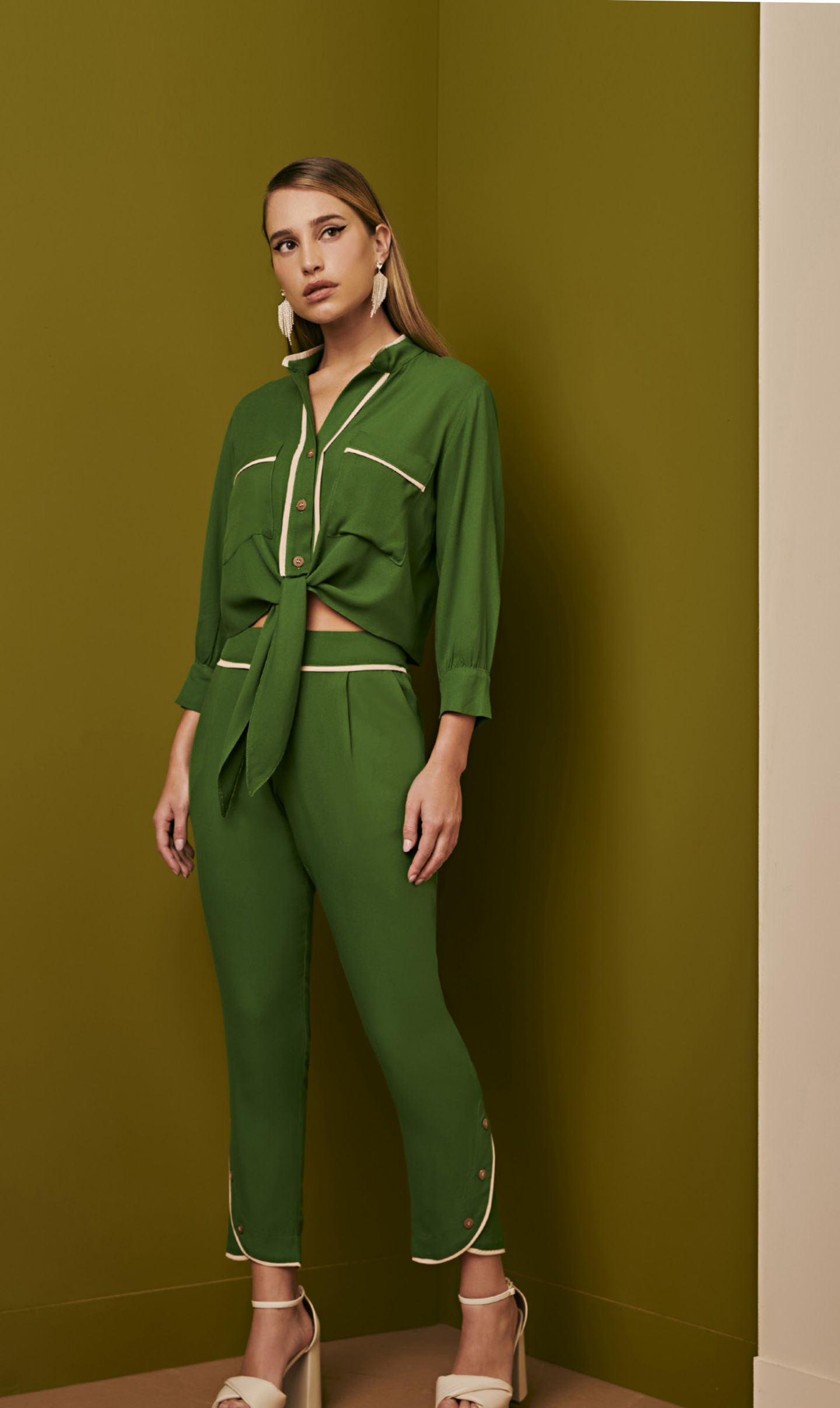
19 CONJUNTO • P M G | Viscose Sarjada | Verde