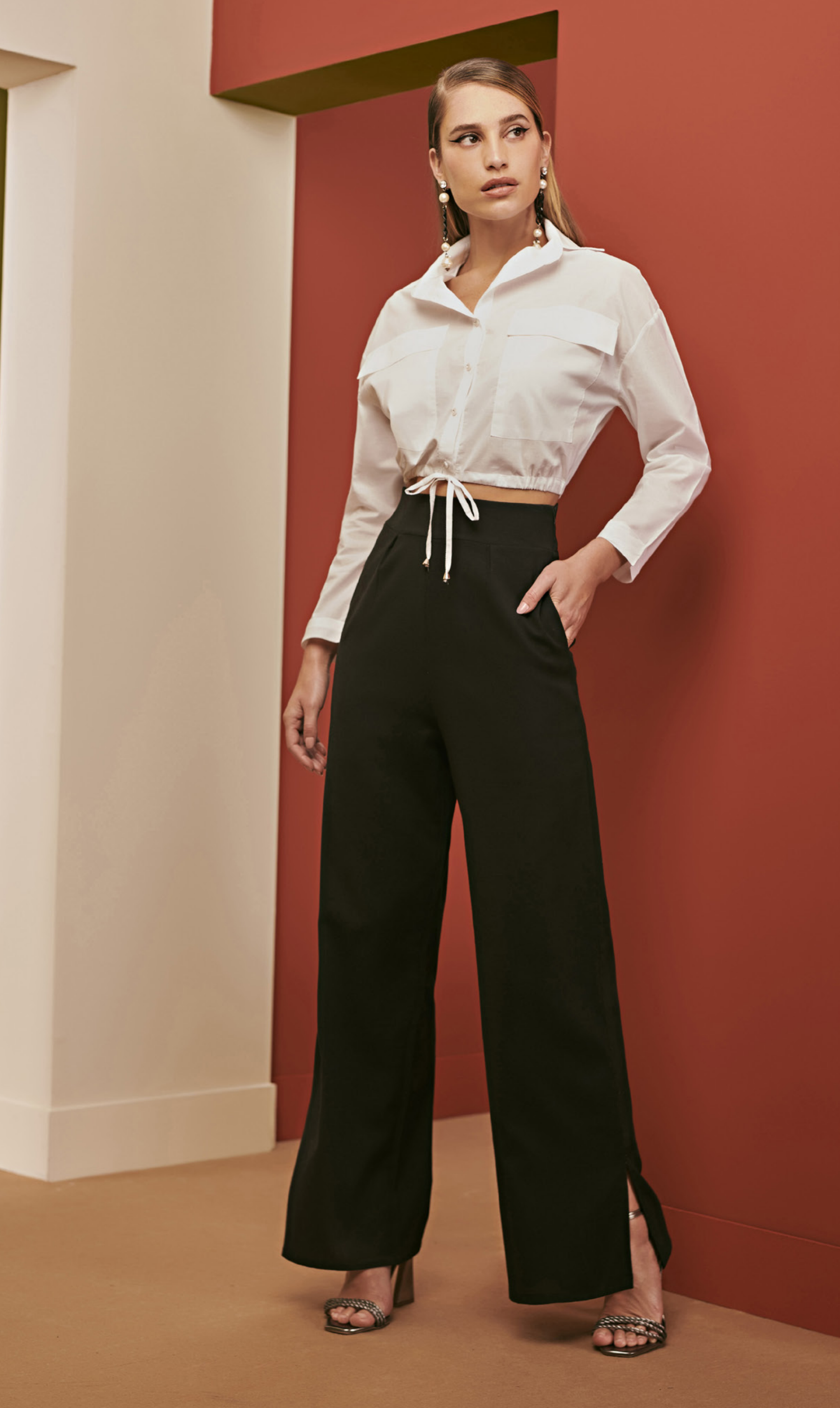
6 CROPPED • P M G | Tricoline | Off White