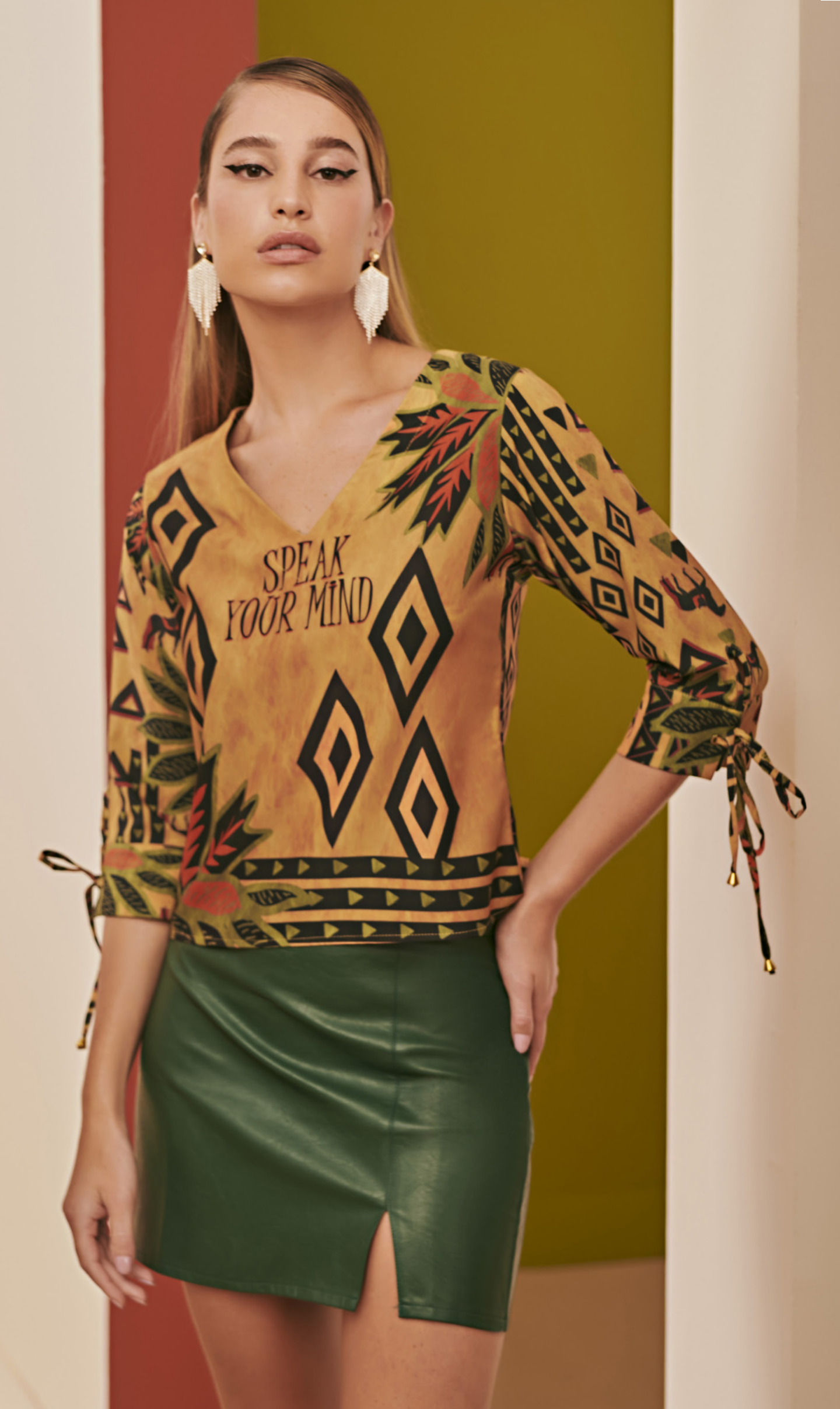
2 BLUSA • P M G | Crepe Twill | Estampada