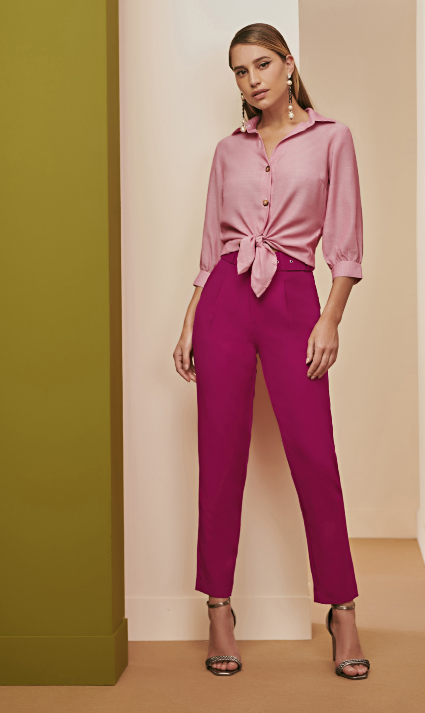
78 CAMISA • P M G | Crepe | Rosa CALÇA • P M G | Crepe Alfaiataria | Marsala