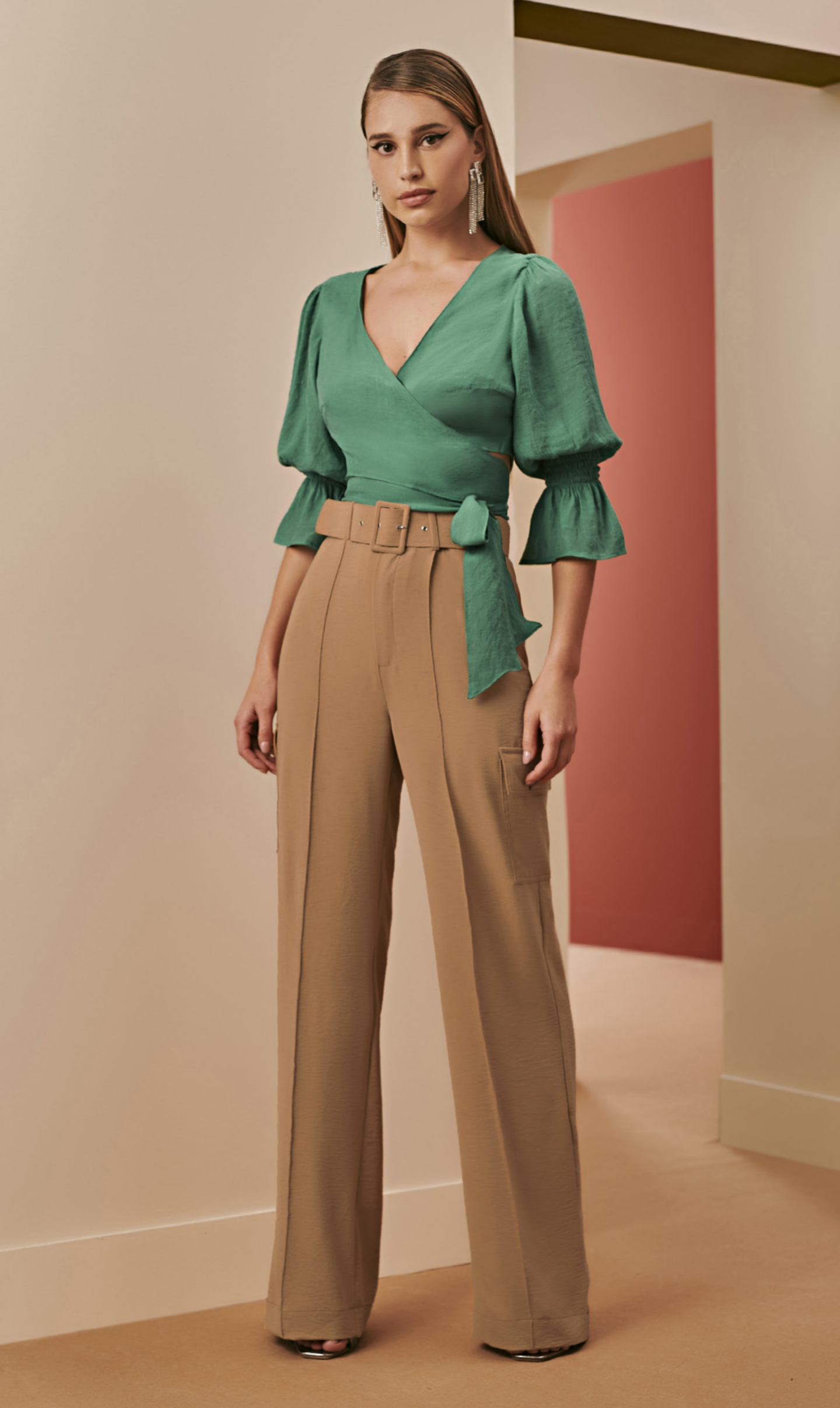
75 BLUSA • P M G | Crepe | Verde CALÇA • P M G | Crepe | Caramelo