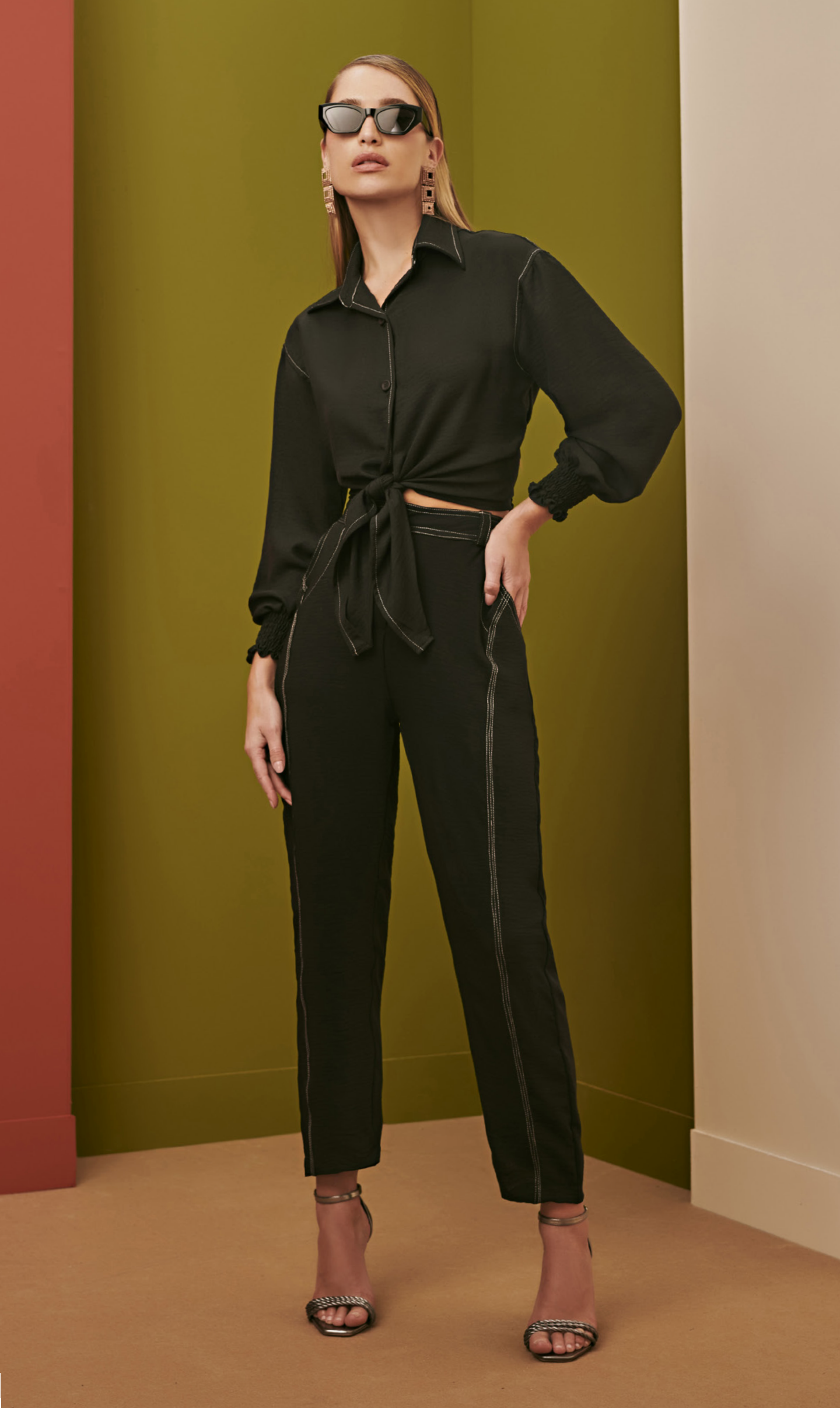
32 CONJUNTO • P M G | Crepe Valentino | Preto