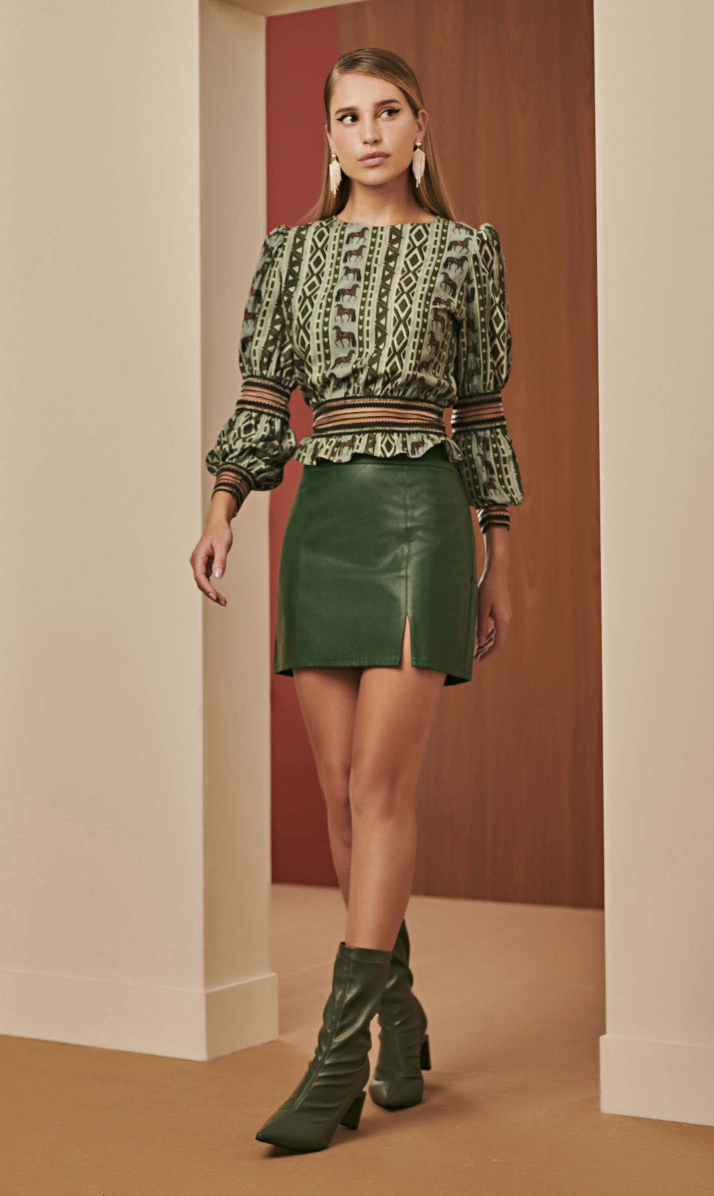
4 BLUSA • P M G | Crepe Twill | Estampada