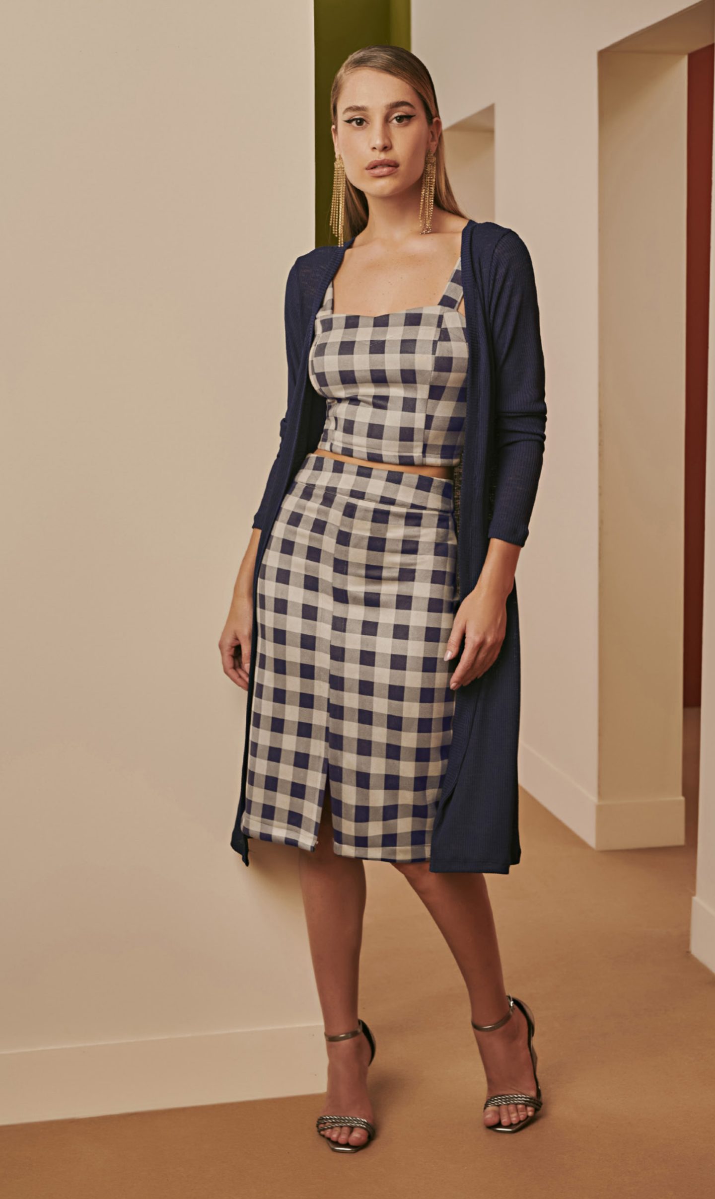
45 KIMONO • P M G | Malha Suede Canelada | Azul