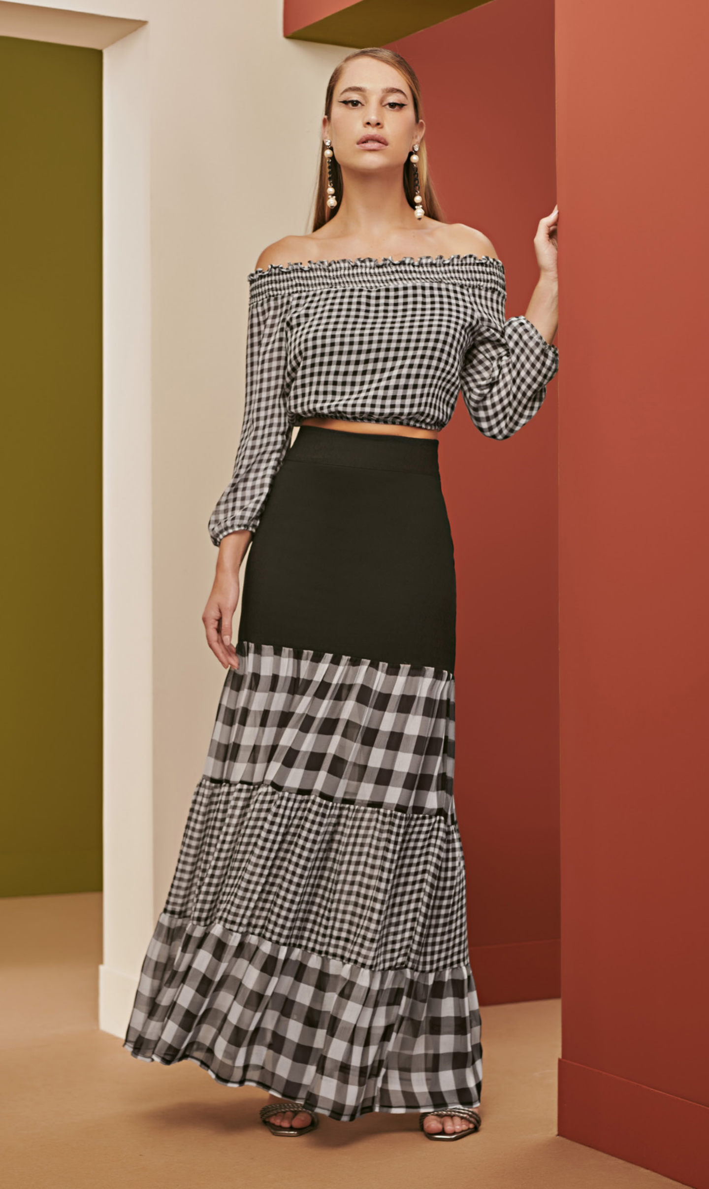
49 CONJUNTO • P M G | Transparência Vichy | Xadrez