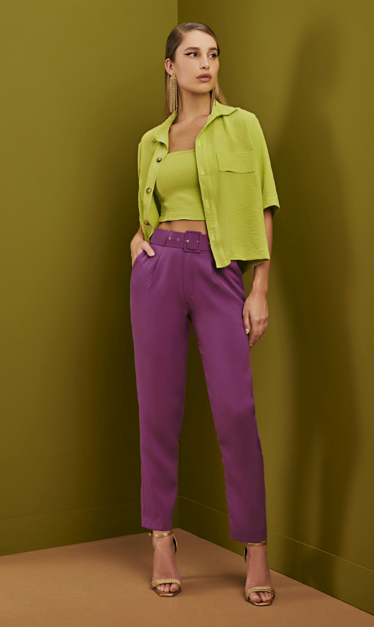
77 CAMISA • P M G | Crepe | Verde Lima CROPPED • P M G | Crepe | Verde Lima