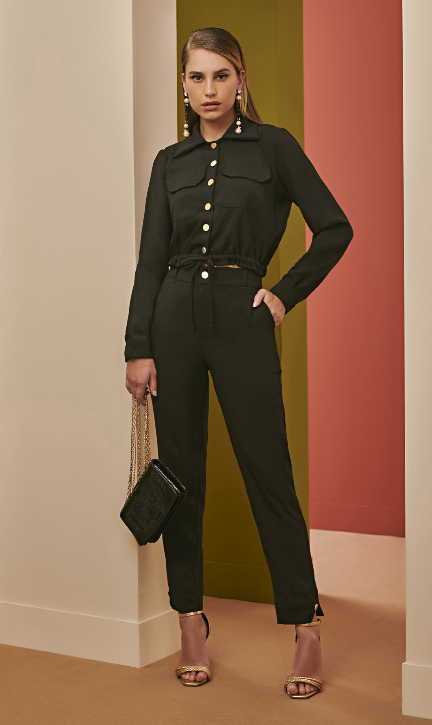
70 CONJUNTO • P M G | Linho Rústico | Preto