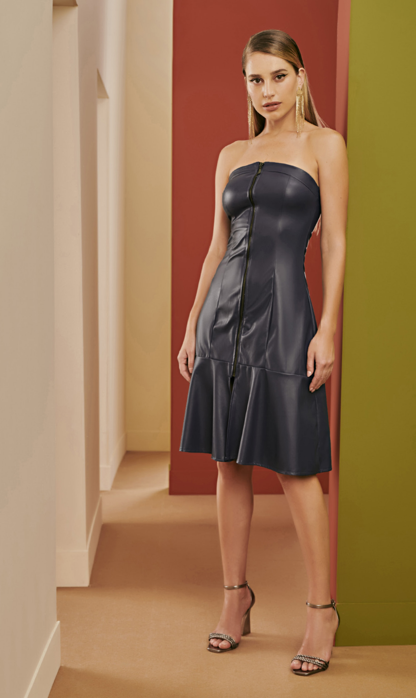
47 VESTIDO • P M G | Malha Royal Lthr Indy | Azul Marinho