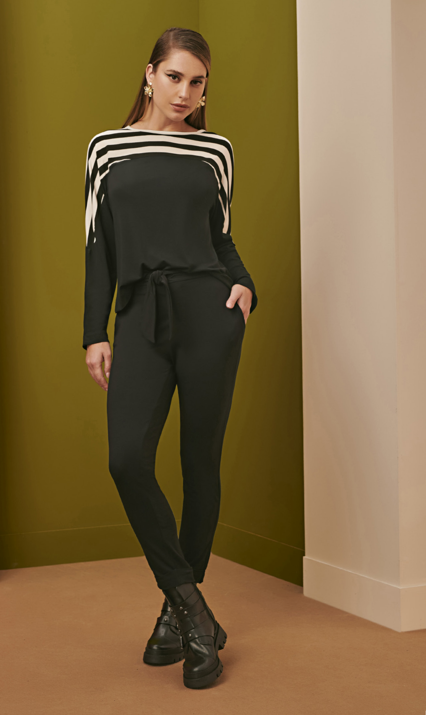
33 CONJUNTO • P M G | Vicolycra | Preto/Listrado