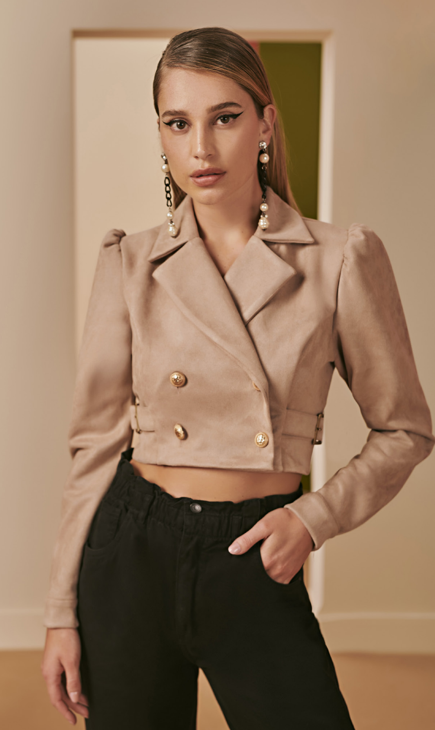
74 JAQUETA • P M | Suede | Palha