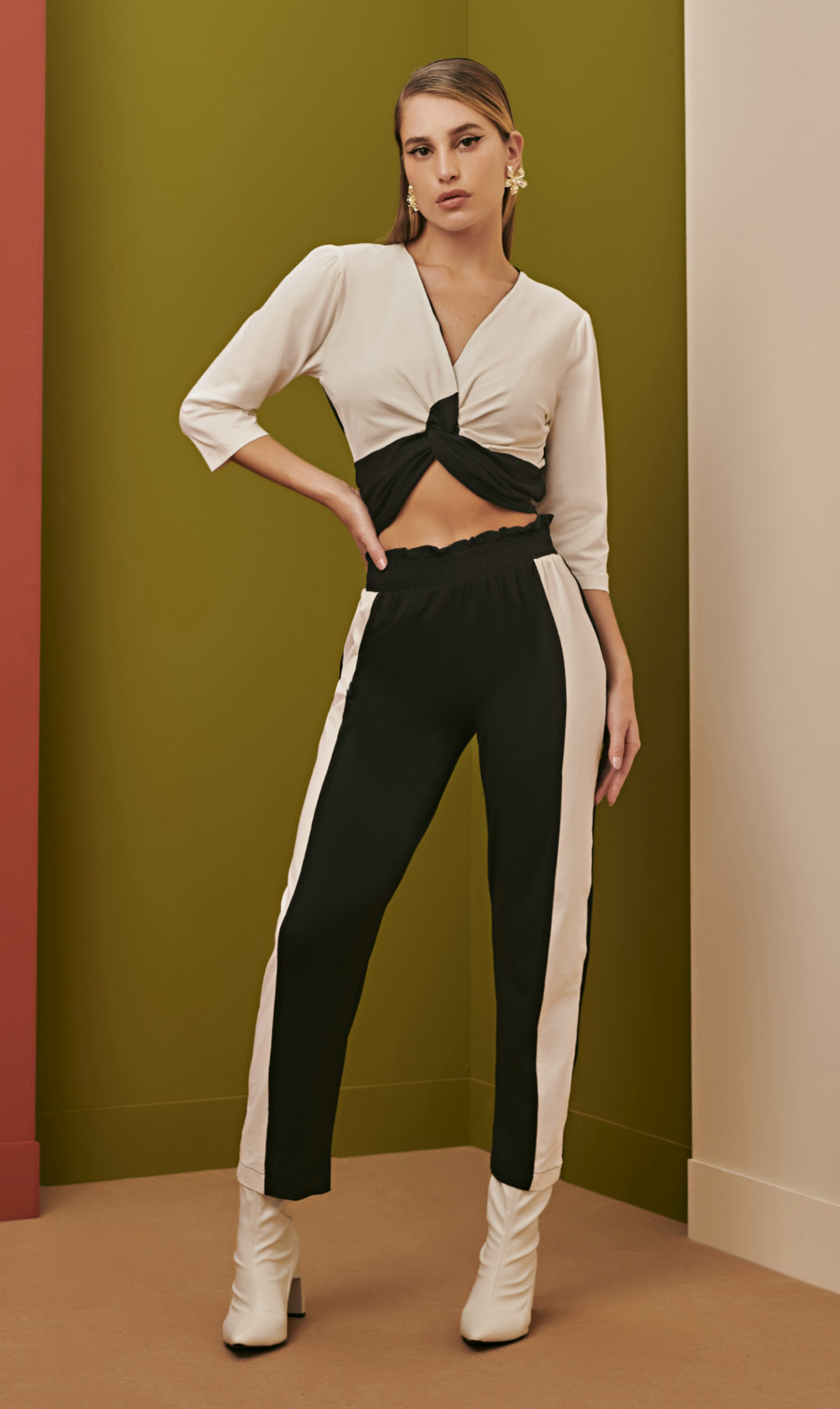
34 CONJUNTO • P M G | Viscolykra | Preto/Off White