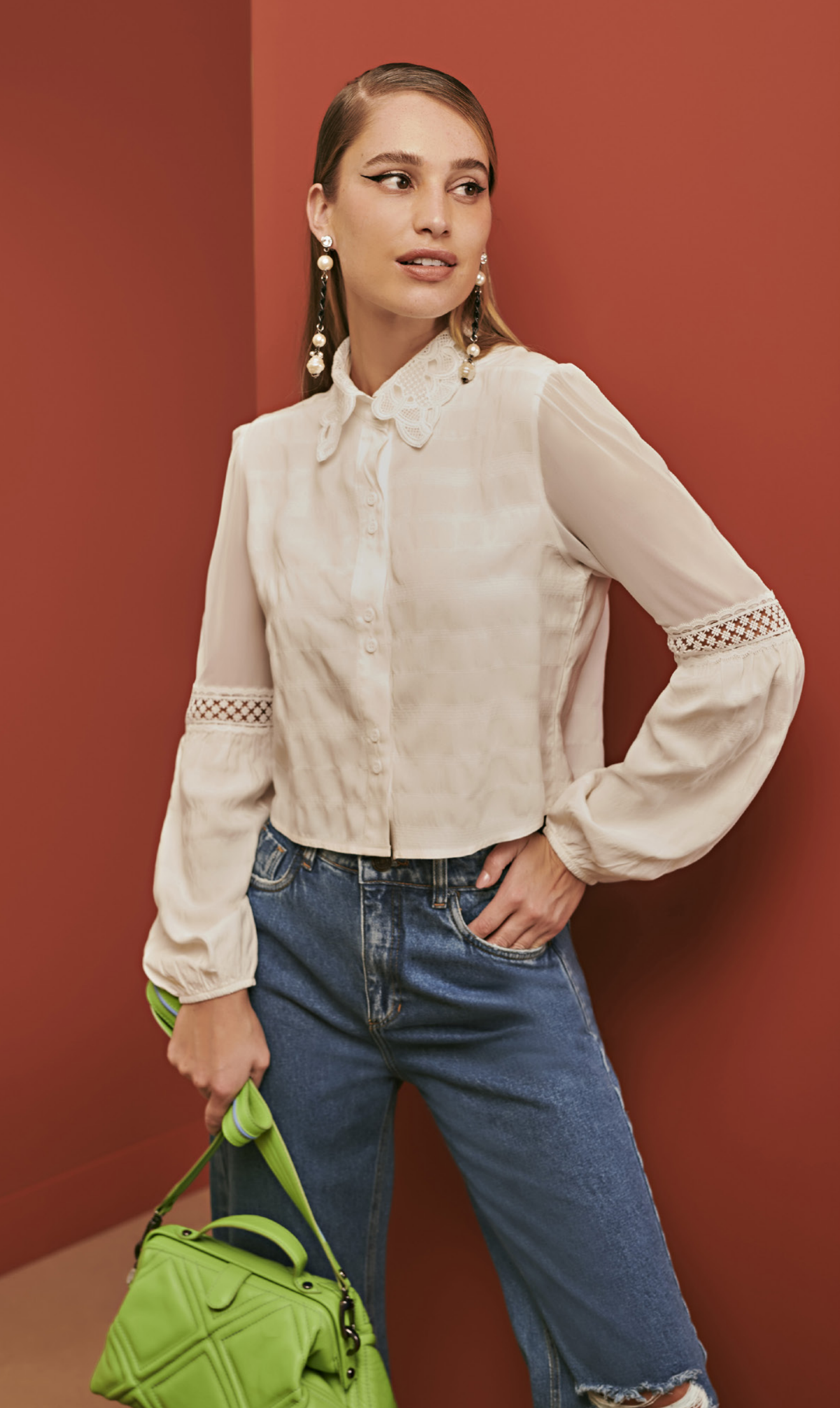
7 CAMISA • P M G | Tricoline | Off White