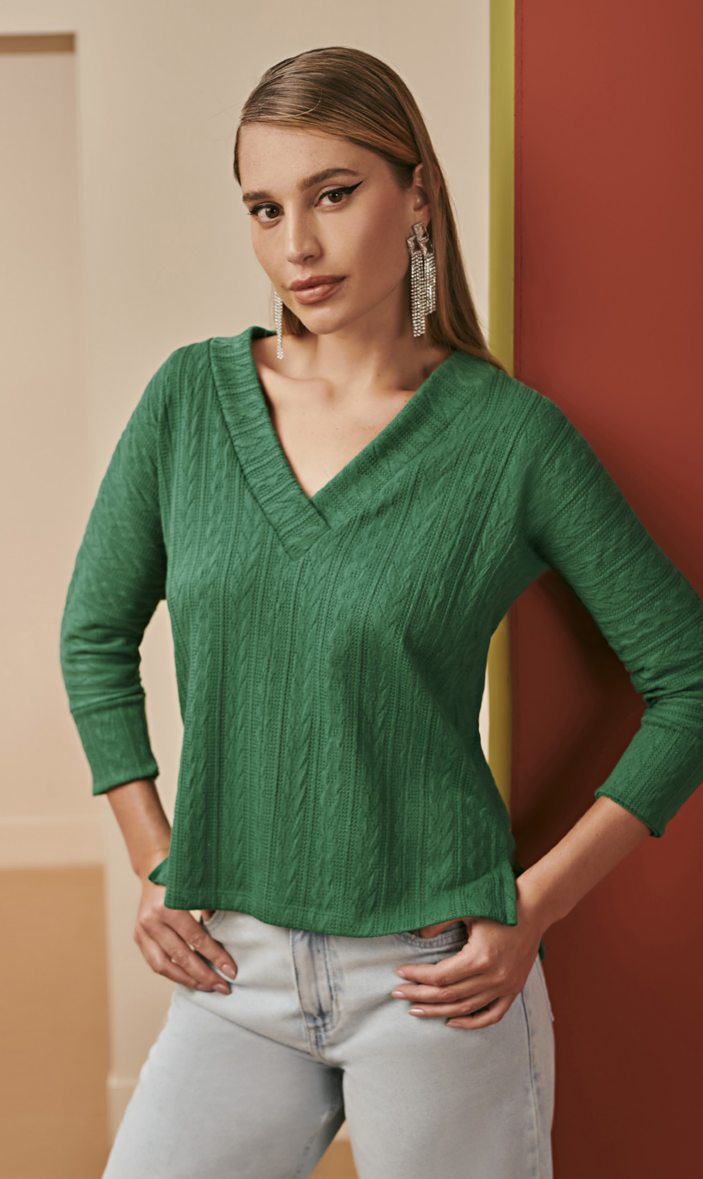
16 BLUSA • P M G | Tricot | Verde