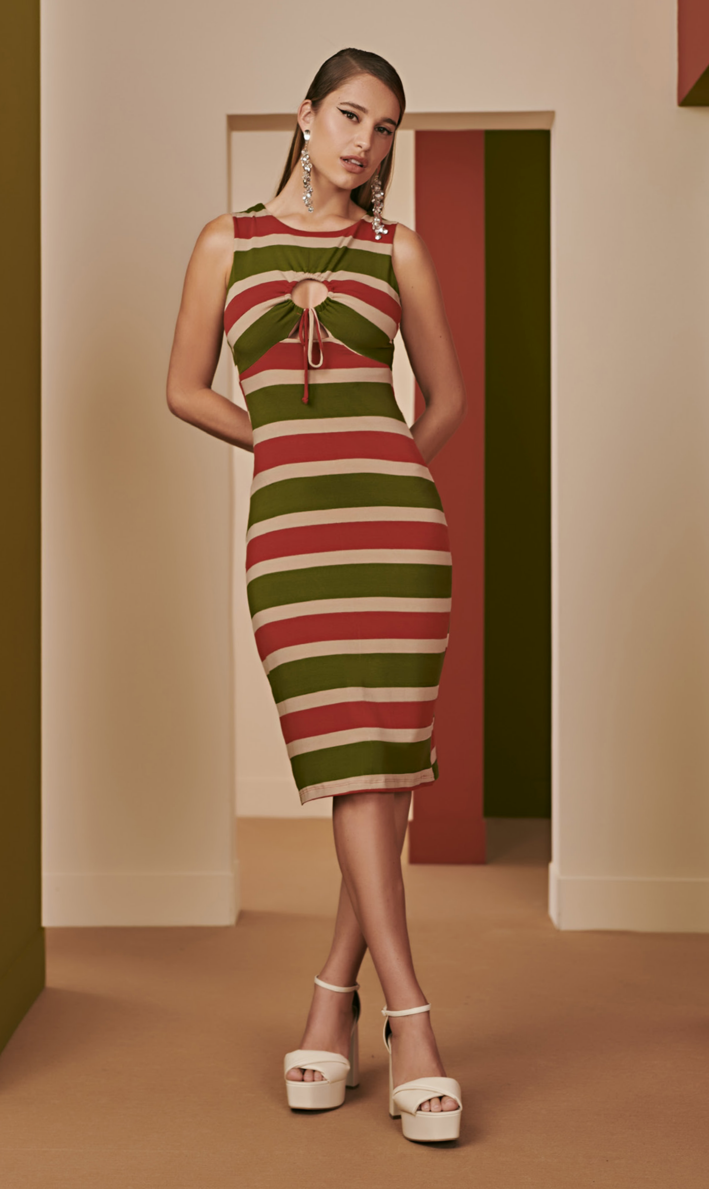
40 VESTIDO • P M G | Malha Geo Dua Stripe | Listrado