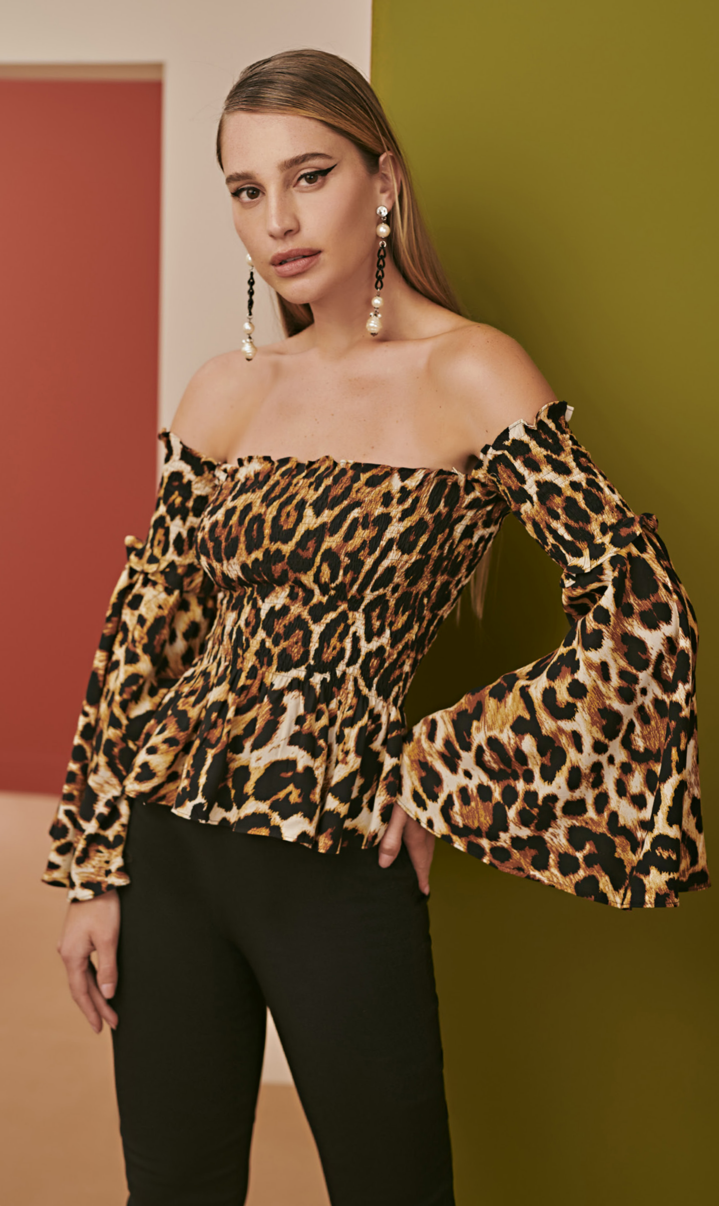
50 BLUSA • P M G | Viscose Mônaco | Estampada